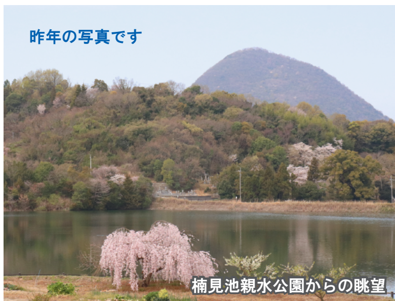
楠見池親水公園からの眺望