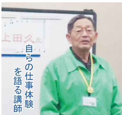
自らの仕事体験を語る講師

は、午前6時55分、防災行政無線機を使って緊急避難放送で避難を呼びかけ、訓練を開始しました。当日の天気が危ぶまれましたが、西坂元地区・真時地区から飯山総合学習センター駐車場訓練会場に、約230名の住民の皆さんが訓練に参加されました。